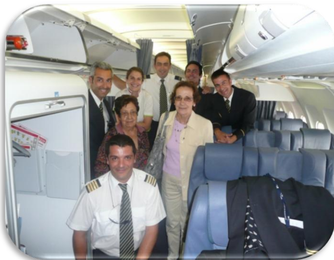
Associadas do Coração Amarelo foram Tripulantes por um Dia

O nosso VCA Duarte prepara novos voos de que vos daremos conta nas próximas edições.